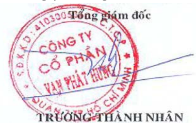
TRƯƠNG THÀNH NHÂN